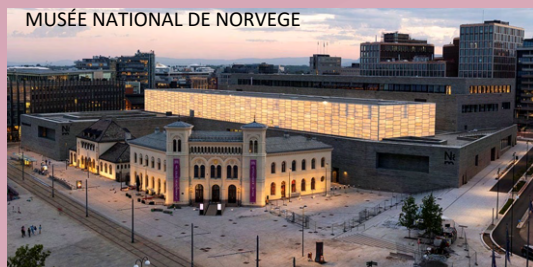
MUSÉE NATIONAL DE NORVEGE