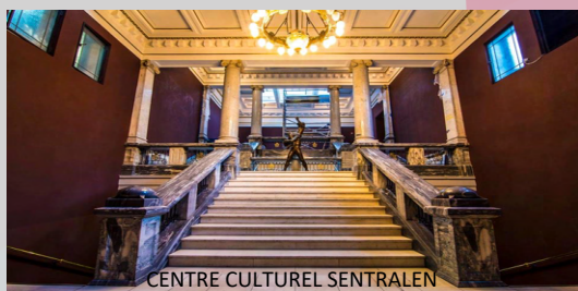
CENTRE CULTUREL SENTRAALEN