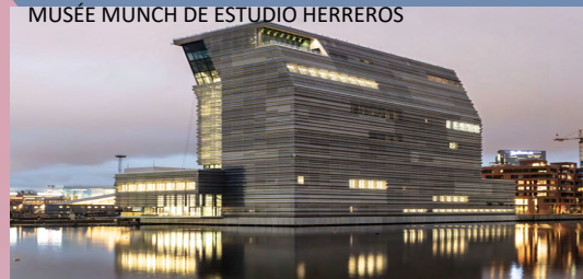
MUSÉE MUNCH DE ESTUDIO HERREROS