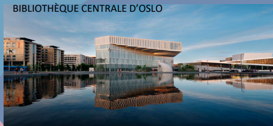
BIBLIOTHÈQUE CENTRALE D'OSLO